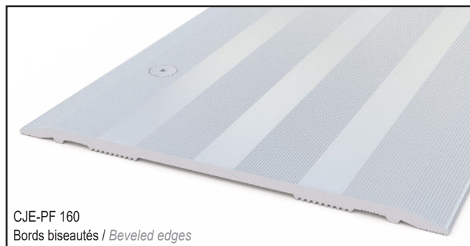
CJE-PF 160 Bords biseautés / Beveled edges

En option, des bandes EPDM permettant d'atténuer les désagréments sonores liés au passage de véhicules sont disponibles.