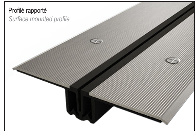
Profilé rapporté Surface mounted profile

Watertight floor expansion joint for car parks and any other places with or without traffic of slow vehicles. It is made of two mill finish aluminium or steel side plates and an interchangeable waterproofing flexible insert.