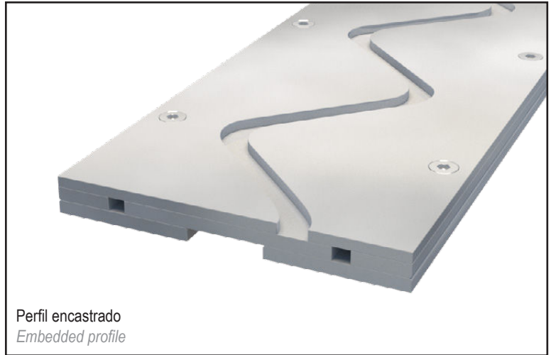
Perfil encastrado Embedded profile

The special design of this profile avoids any vibrations when passing vehicles.