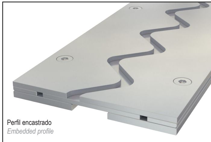
Perfil encastrado Embedded profile

It is specially designed to support very heavy loads (forklifts with hard wheels, trucks and pallet trucks). The special design of this profile avoids any vibrations when passing vehicles.