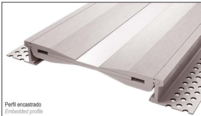
Perfil encastrado Embedded profile