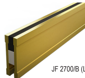
JF 2700/B (Laiton)