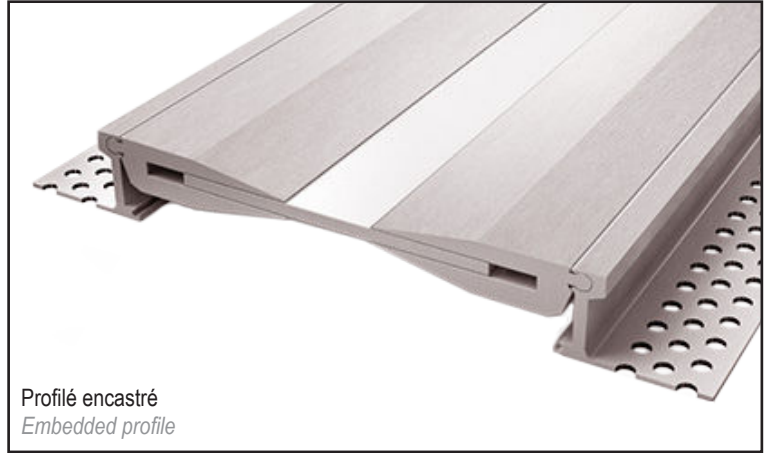
Profilé encastré Embedded profile