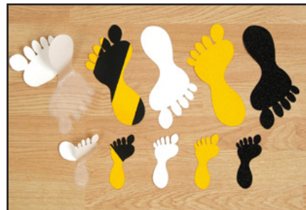
Toutes formes possibles