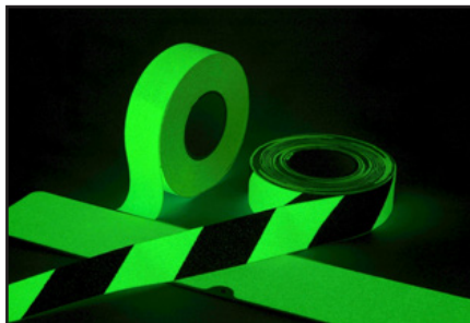
Photo Grip version nuit