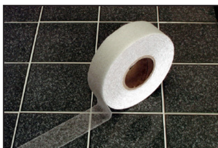
Incolore sur carrelage