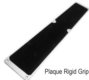
Plaque Rigid Grip