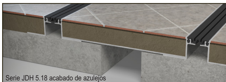
Serie JDH 5.18 acabado de azulejos