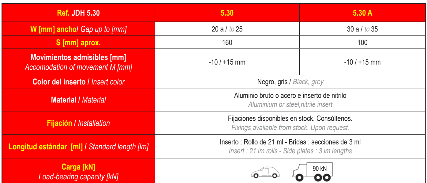
Floor to Wall

La capacidad de carga se da en todo caso para una junta en posición inicial. En el caso de movimientos de la abertura, la capacidad de carga se reduce considerablemente y el producto sólo será adecuado para un tráfico ligero de peatones. Los valores de carga indicados están basados en vehículos de ruedas neumáticas cuya superficie de contacto es 200x200 mm.