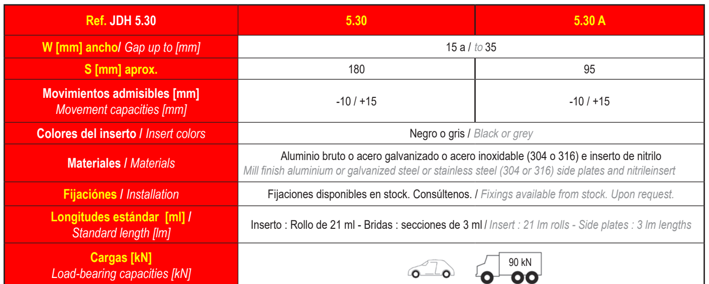
Floor to Wall

Se recomienda pegar las alas laterales del inserto. / We recommend to glue the wings of the insert.