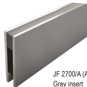
JF 2700/A (Aluminium) Grey insert