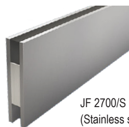
JF 2700/S (Stainless steel)