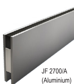
JF 2700/A (Aluminium)