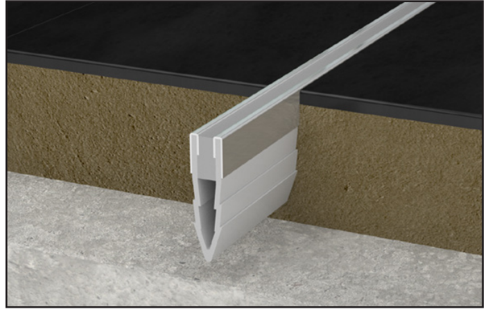
JF 700/S gris / JF 700/S grey

Control joints for floors made to prevent the malfunctions (cracks, debonding) that systematically occur when flooring systems are installed in large areas without joints. They are used to partition bed affixed floors such as tiles, ceramic, natural stone, etc. They are supplied with stainless steel or brass caps for a more luxurious finish.