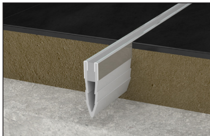
JF 700/S gris / JF 700/S grey

They are supplied with stainless steel or brass caps for a more luxurious finish.