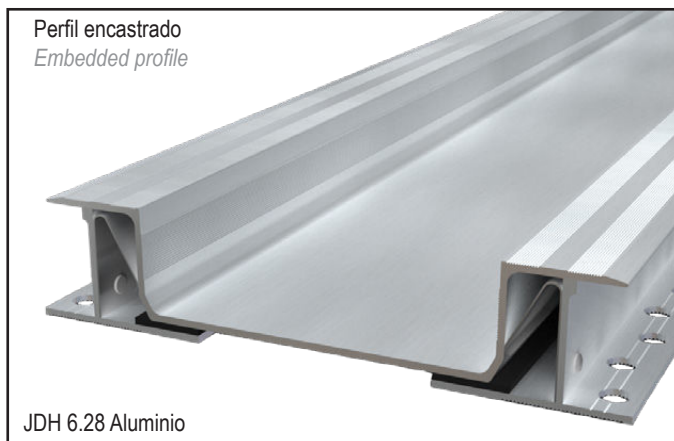
JDH 6.28 Aluminio

Seismic expansion joint specially designed for tiles or stones, for exterior and interior use. Central pan in 304 stainless steel or aluminium, side plates in aluminium.