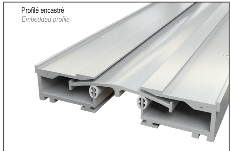
JDH 6.26-050 A avec cornière invisible With invisible side plate