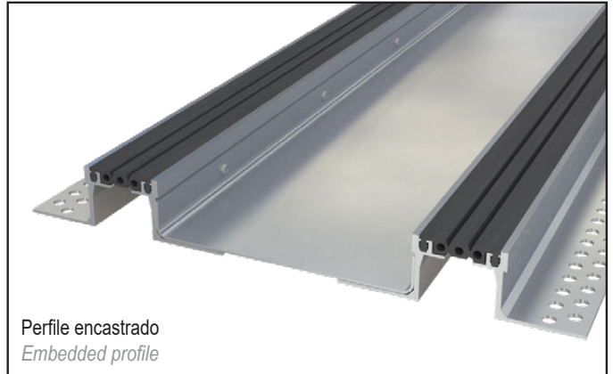
Perfil encastrado Embedded profile

Suitable for all types of finishes: concrete slab, screed, tiles, marble... Brass or stainless steel capping are also available for a luxurious and aesthetical finishing, or for use in food industry.