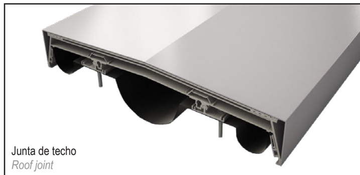
Junta de techo Roof joint

Watertight seismic expansion joint for efficient and durable covering of roof expansion joints. Made of a continuous watertight membrane associated with a cover. This system is able to cope with significant three-dimensional movements.