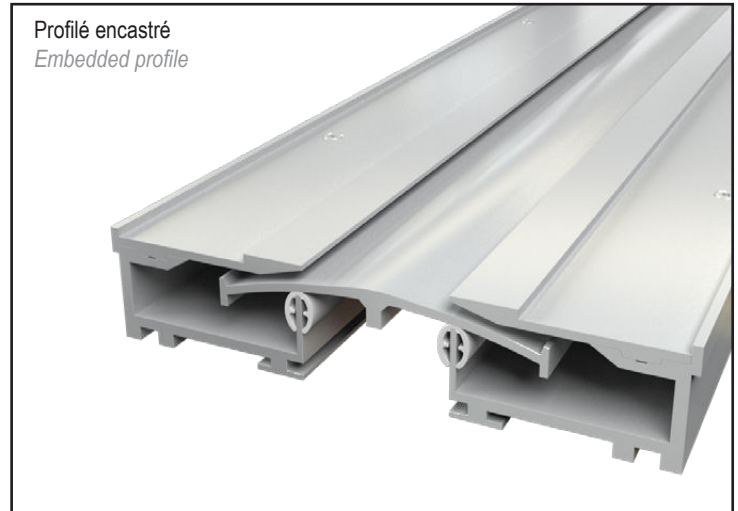
JDH 6.26-050 A avec cornière invisible With invisible side plate