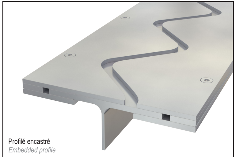
Profilé encastré Embedded profile

The special design of this profile avoids any vibrations when passing vehicles.