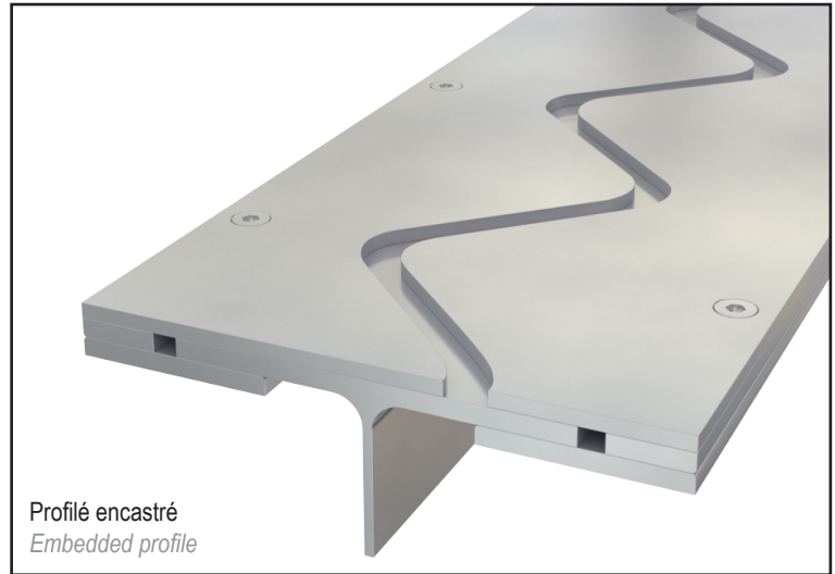
Profilé encastré Embedded profile

The special design of this profile avoids any vibrations when passing vehicles.