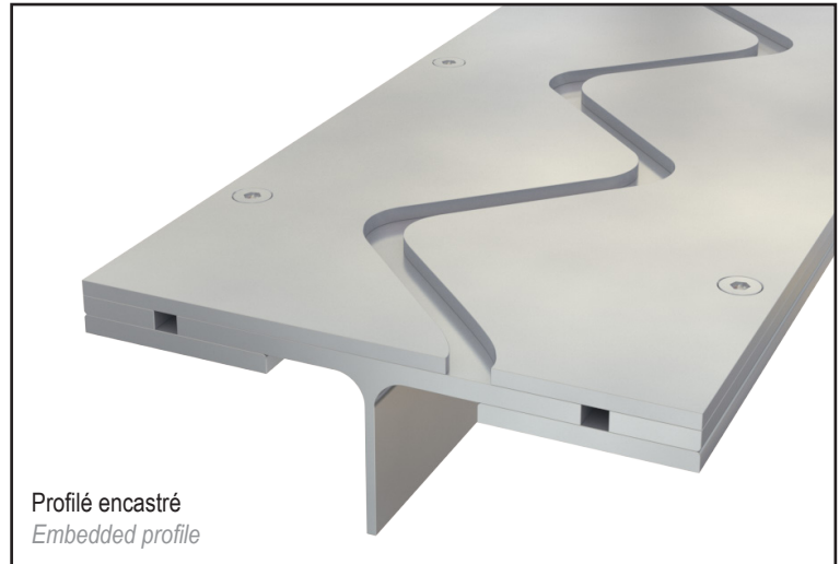
Profilé encastré Embedded profile

The special design of this profile avoids any vibrations when passing vehicles.