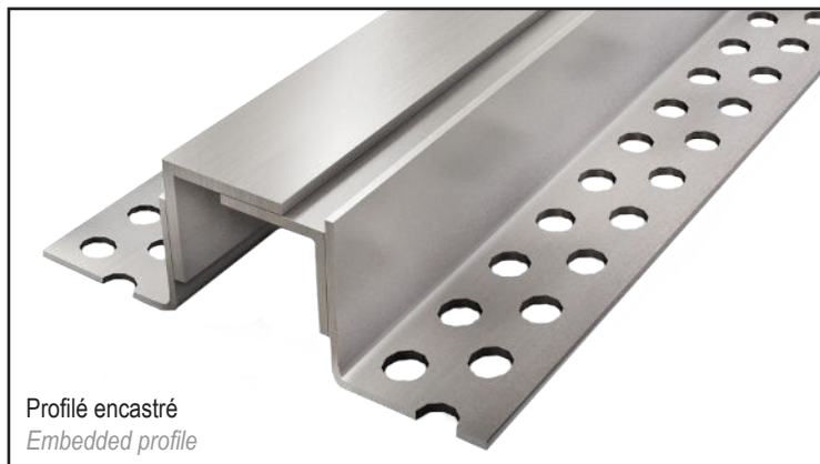
Profilé encastré Embedded profile

Mechanical floor expansion joint for exterior and interior, made of two stainless steel side plates or aluminium upon request. For all types of finishes: tiles, marble, natural stone, resin, flexible floors... Available stainless steel finishes: mill, polished, brushed or gloss finish.