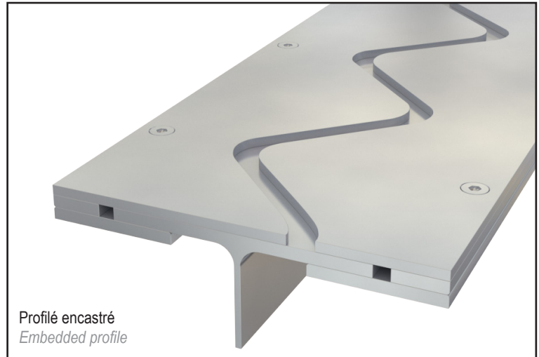
Profilé encastré Embedded profile

The special design of this profile avoids any vibrations when passing vehicles.