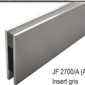
JF 2700/A (Aluminium) Insert gris