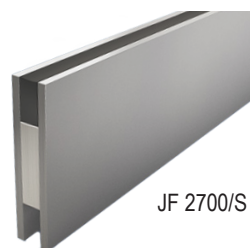
JF 2700/S (Inox)