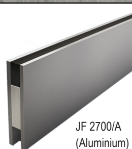
JF 2700/A (Aluminium)